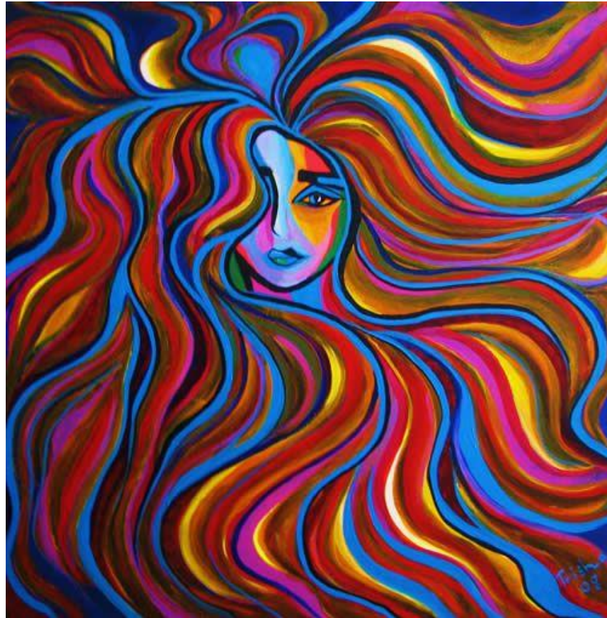
Nome da obra: “Cabelos” Autora: Trisha Keiman (2008)