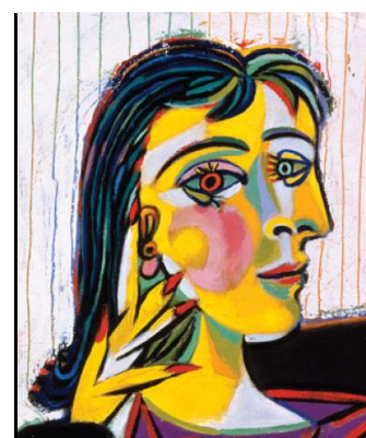
Fragmentos retirados de obras do pintor cubista: Pablo Picasso