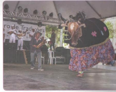
APRESENTAÇÃO DO BOI DE MAMÃO EM ANTONINA, NO PARANÁ.