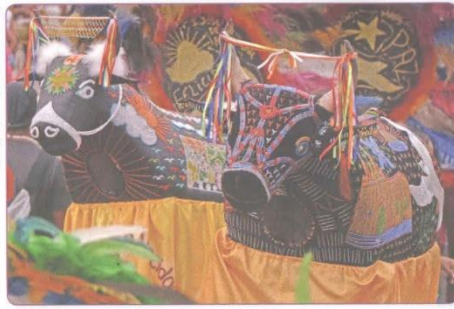
BUMBA MEU BOI EM SÃO LUÍS, NO MARANHÃO.

OBSERVE AS IMAGENS DO BOI EM DIFERENTES FESTAS. DEPOIS, CONFECCIONEM COLETIVAMENTE UM BOI PARA BRINCAR.