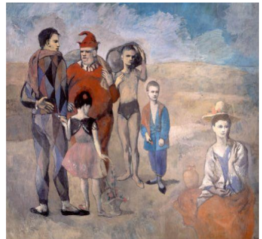
“Família de Saltimbancos” (1905)