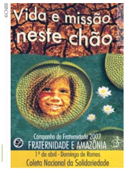
Cartaz da Campanha da Fraternidade 2007

Todos os anos, durante a Quaresma, a Conferência Nacional dos Bispos do Brasil realiza a Campanha da Fraternidade para promover reflexões sobre temas sociais relevantes. Em 2007, o tema “Fraternidade e Amazônia” tratou da biodiversidade da região e da importância de preservá-la para a manutenção da vida em todo o planeta. As populações indígenas locais também foram valorizadas. Os documentos dessa campanha discutem a maneira como a ganância e o egoísmo causam danos ao ecossistema e acabam com milhões de vidas.