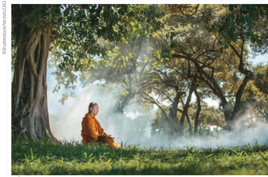
Meditação budista na natureza

No budismo, há um profundo respeito pela natureza. Muitos seguidores de Buda não consomem carne ou outros alimentos de origem animal, pois acreditam que devem preservar os recursos naturais, defendendo a vida de toda as espécies.