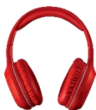
FONE DE OUVIDO