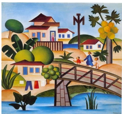
“O Mamoeiro” (1925)

Observe os três quadros da artista Tarsila do Amaral abaixo: