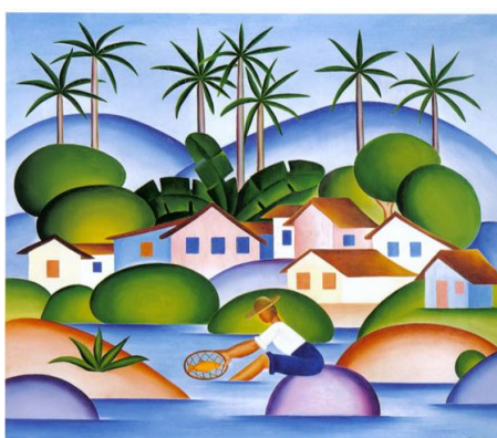
“O Pescador” (1925)