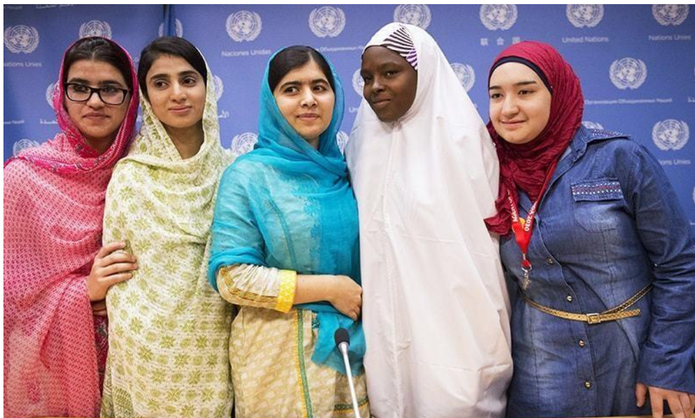
MALALA YOUSAFZAI (CENTRO), NOVA YORK, ESTADOS UNIDOS, 2015

MENINOS E MENINAS TÊM ALGUMAS CARACTERÍSTICAS IGUAIS E OUTRAS DISTINTAS, MAS NENHUMA DELAS É MOTIVO PARA SEREM TRATADOS DE FORMA DIFERENTE.