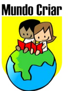
Ilustração Roney Bunn