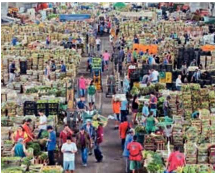
Comércio atacadista na Companhia de Entrepostos e Armazéns Gerais de São Paulo (Ceagesp), em São Paulo, SP (2017).

Atualmente, tanto o comércio varejista quanto o atacadista, interno ou externo, estão sendo influenciados pelas inovações tecnológicas, principalmente nas áreas de comunicação e de informática. É possível vender e comprar produtos sem sair de casa ou da empresa. Por meio de correspondência, da internet ou do telefone ( telemarketing ), podemos adquirir produtos e serviços variados. O uso cada vez mais comum de cartões de crédito facilita o chamado comércio on-line .