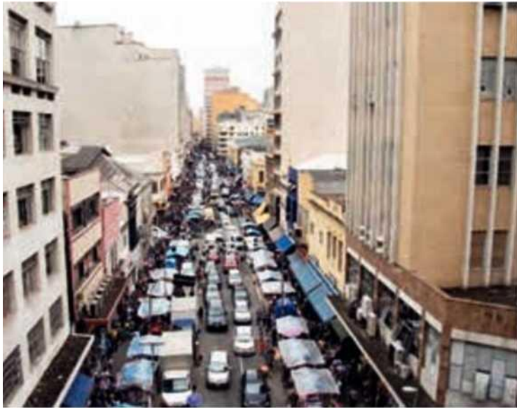
Vista aérea do comércio na Rua 25 de Março, em São Paulo, SP (2017).

O comércio, externo ou interno, pode ser definido como varejista ou atacadista.