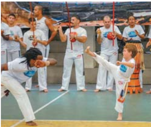
Roda de capoeira no Rio de Janeiro