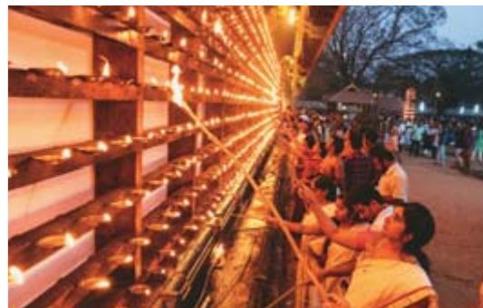
Festa Diwali na Índia com velas acesas