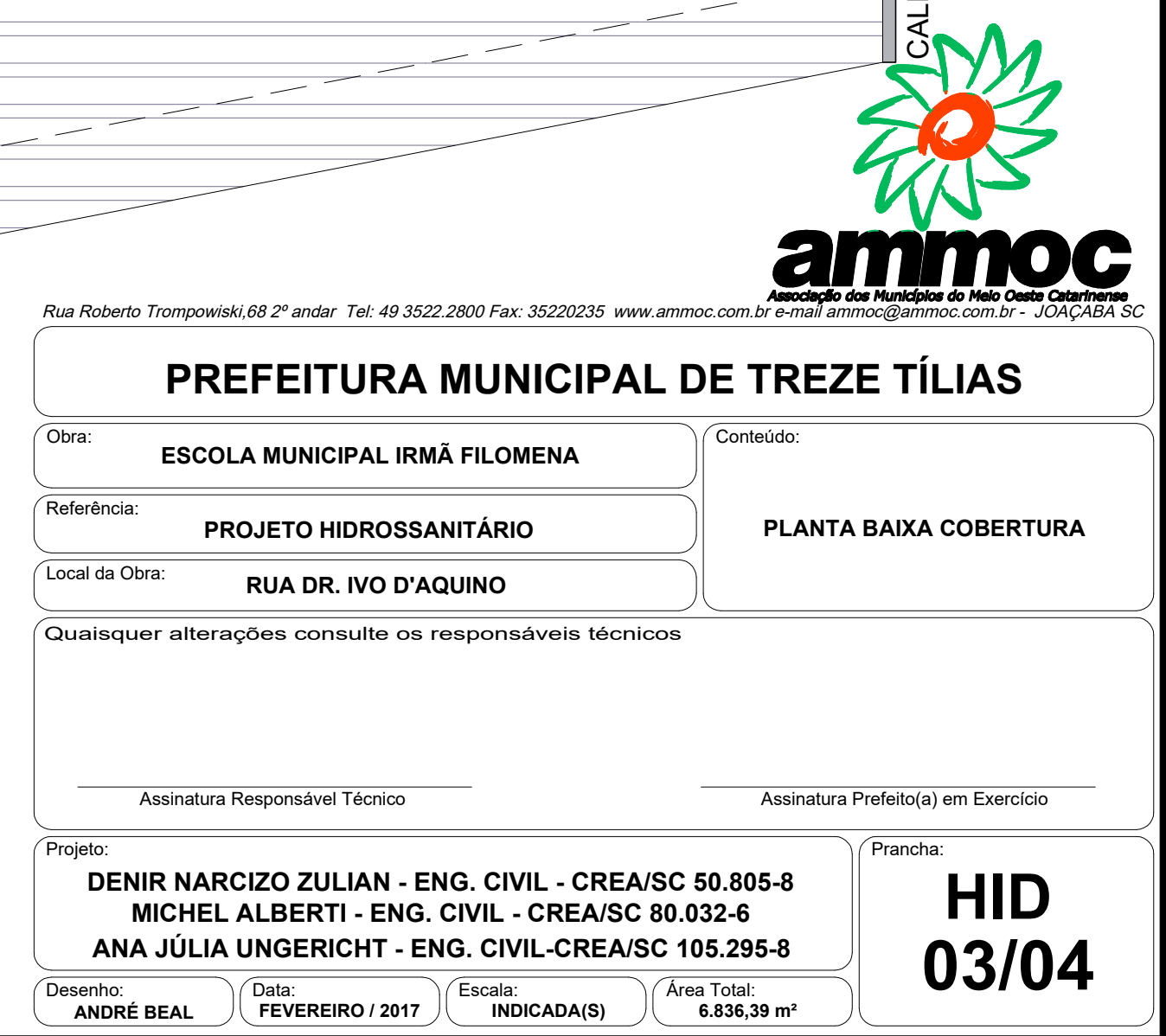
PLANTA DE COBERTURA Escala 1:75