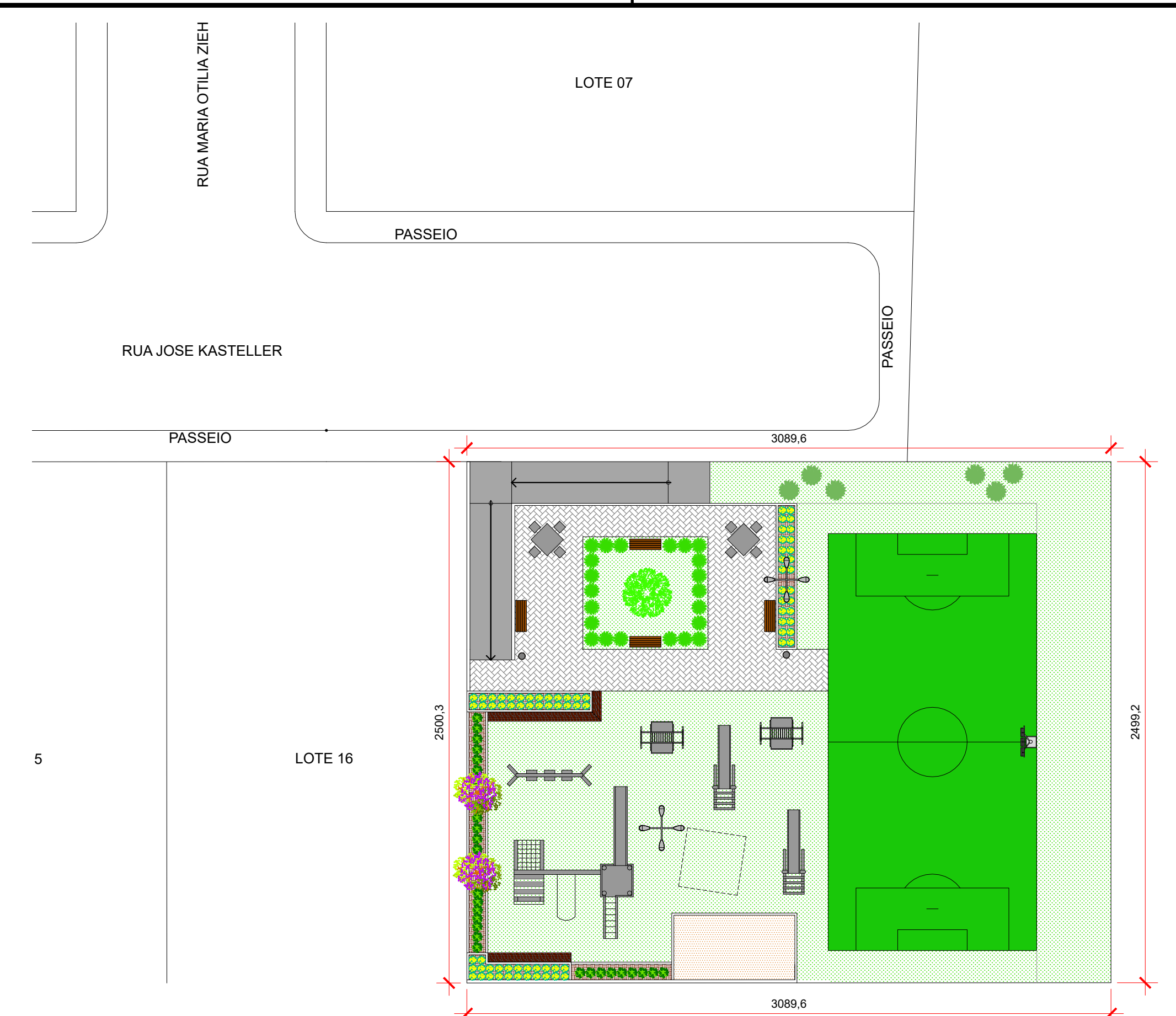
Implantação Esc: 1/200