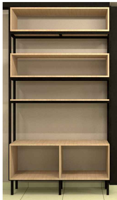
27 Detalhe 13 Sem escala