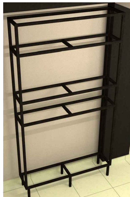
28 Estrutura Sem escala

Movel 13 - 02 unidades Sugestão de uso: Movel 13 - exposição de artigos rusticos e "pesados".