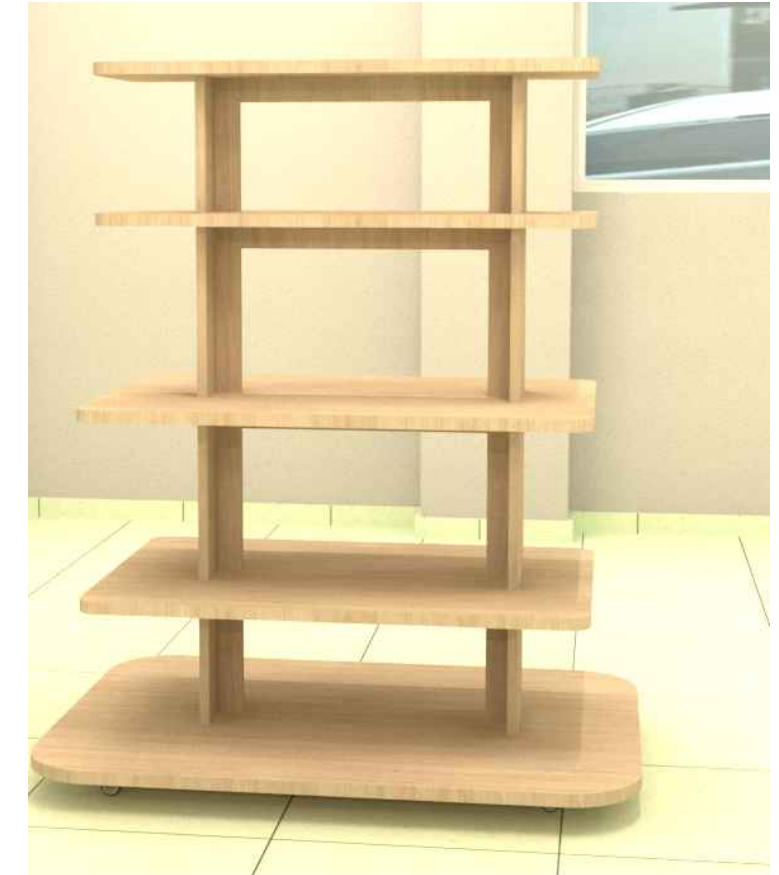
36 Detalhe 17 Esc: 1/25