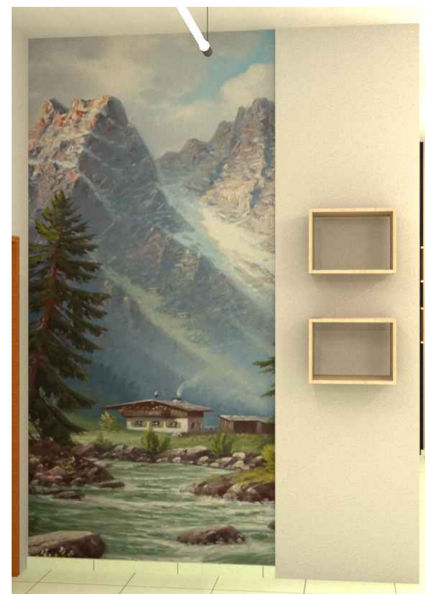
63 Detalhe 29 Sem escala

Nicho - 02 unidades Sugestão de uso: Decorações específicas /sazonais.