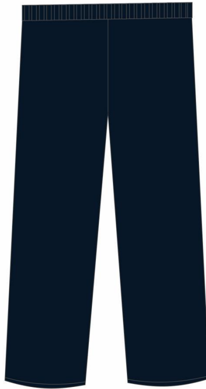
TABELA DE MEDIDAS: CALÇA