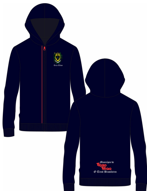
MODELOS TAMANHOS 0 A 6