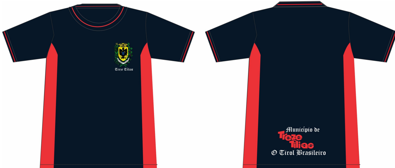
TABELA DE MEDIDAS: CAMISETA MANGA CURTA