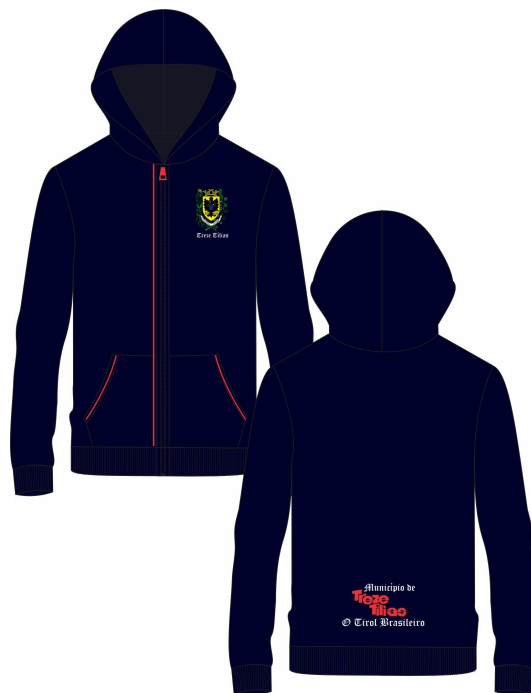
MODELOS TAMANHOS 8 AO XG